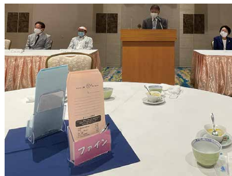
ドネーション・ファイン袋が変わりました。