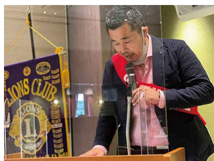
ファイブ・ドネーション報告