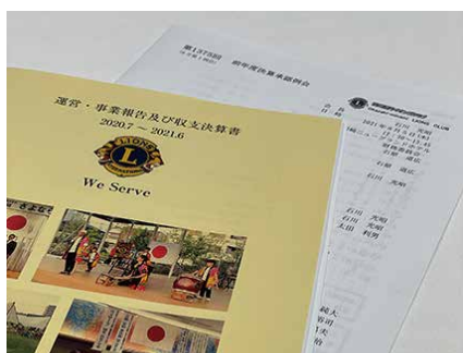
前年度決算承認例会

会場／岡崎ニューグランドホテル 日時／令和 3 年 8 月 5 日 (木) 12:30~13:45 担当／財務委員会 委員長：L. 石原道広