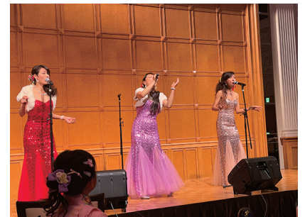
メインアトラクションの Sweet Voice