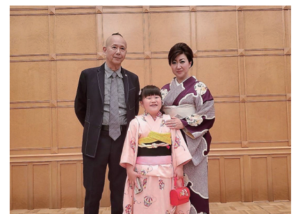
家族揃って楽しいクリスマスでした