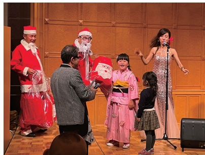
会長サンタ・幹事サンタから ちびっ子たちに Xmas プレゼント