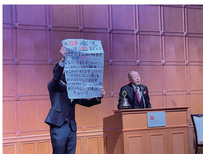
恒例の金言も力が入ります