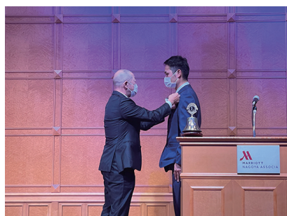
新会員にラベルボタンをつける会長