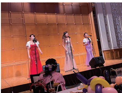
今回も素敵な歌声で 盛り上げてくれました