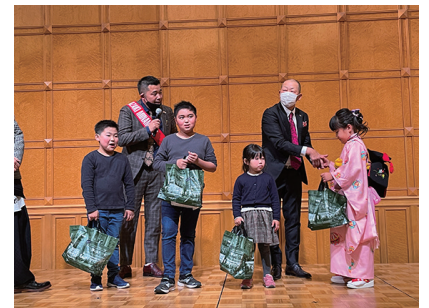
ちびっ子たちにプレゼント