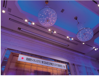
セレモニーも終わりいよいよ 第2部懇親会が始まります