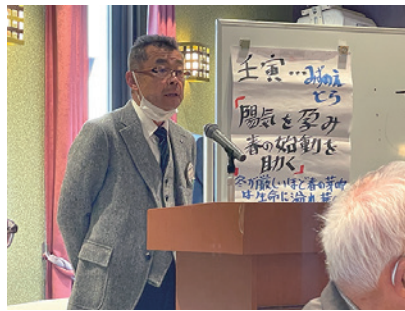
新会員の全体承認