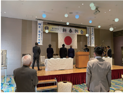
会場を移して例会開会