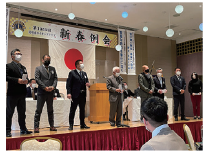
誕生日祝い、結婚祝い、年男祝い