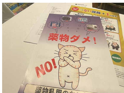
講師 愛知県警OB 海老沢 道也様 テーマ 「西三河地区における犯罪の現状について」