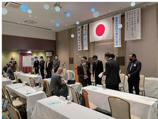
4 名の新会員、入会オリエンテーションに続き、入会式が行われました。