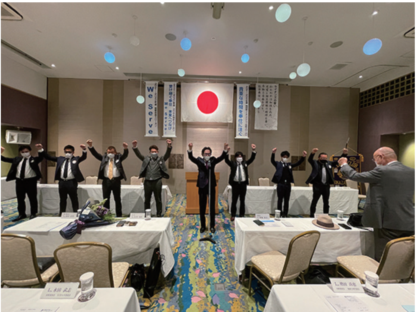
新会員とスポンサーによる「ウォー」。新会員の皆さん、岡崎南ライオンズクラブへようこそ！