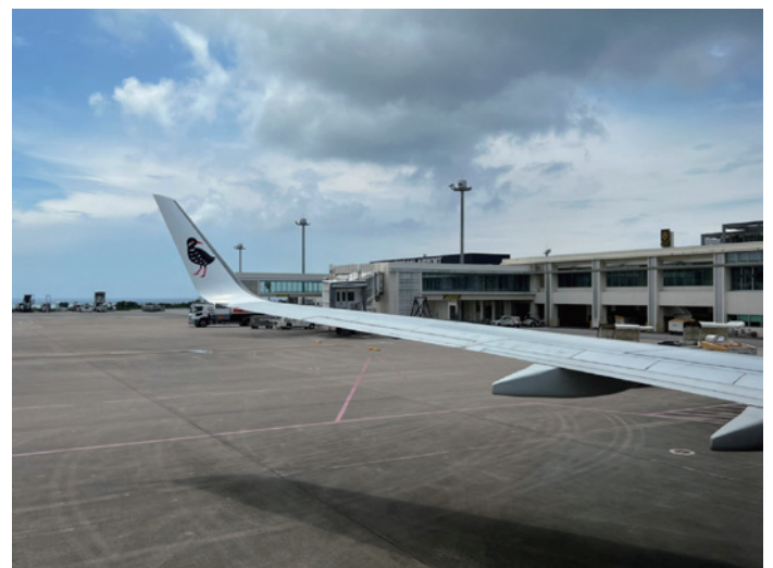
八重山の皆さん、60周年おめでとうございます。そして、熱烈な歓迎ありがとうございました。