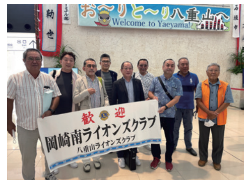
空路石垣では丁寧なお出迎え