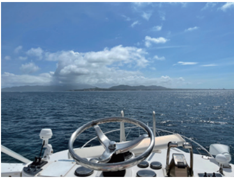
ジェットスキー シュノーケリング パラセーリング に興じました。