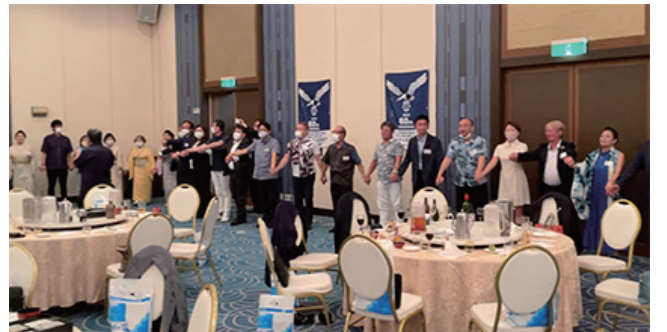
南は石垣から～北は北海道まで、まさに日本を縦断する大きな輪となって「また会う日まで」。お疲れ様でした。