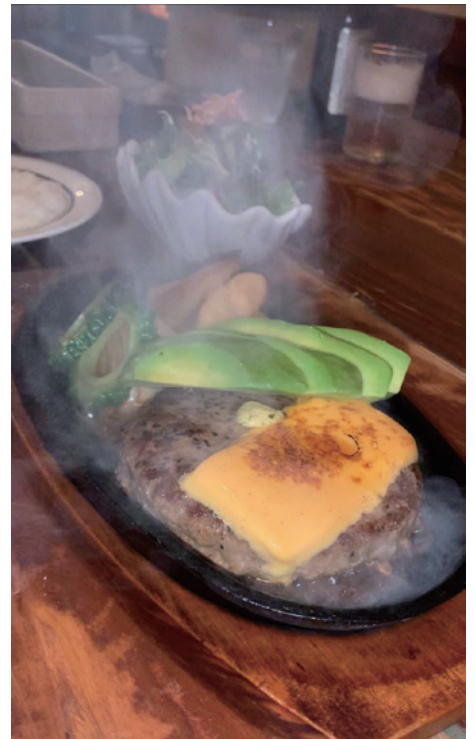
お昼のあつあつハンバーグ