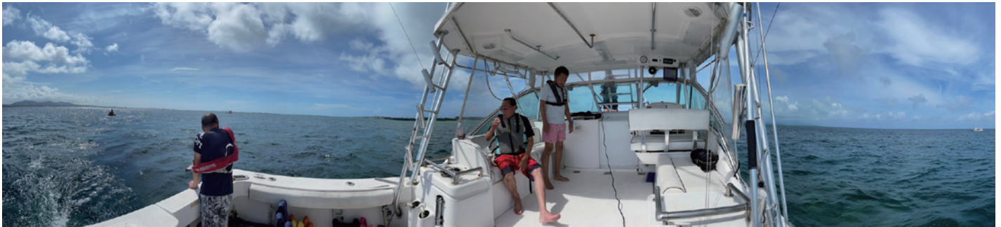
L. 和泉の船「スーパーキャット」で海に出る