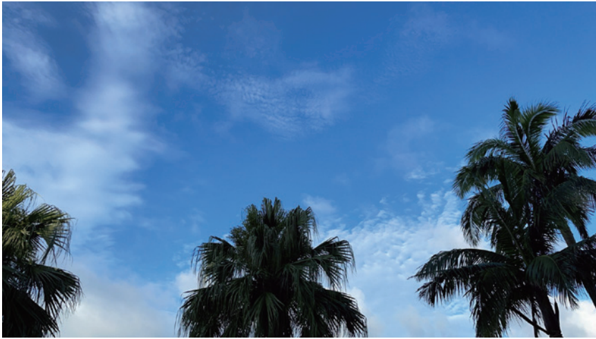
2日目の朝も快晴！式典まではフリータイム。南国石垣を満喫します。