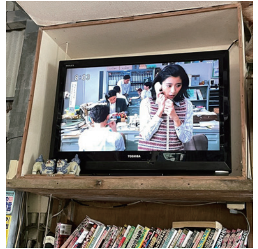
石垣で「ちむどんどん」見てきました