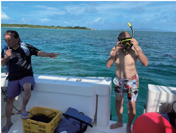
最終日、出発までのわずかな時間をも無駄にしない、石川会長