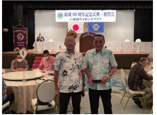
石川会長も八重山空港にタッチダウン！ 記念式典・祝賀会の会場へ。