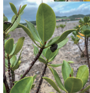
マングローブに ついた貝

今回は、種をたくさんとって、苗木として植栽できるまでに育てる、種の植え付け作業に励みました。